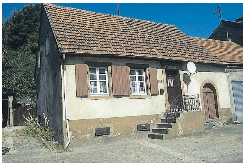
Früheres Prämienhaus mit kleinem Wirtschaftsteil in Ludweiler.

Produktion dieser Seite: Jörg Heinze Bernhard Geber