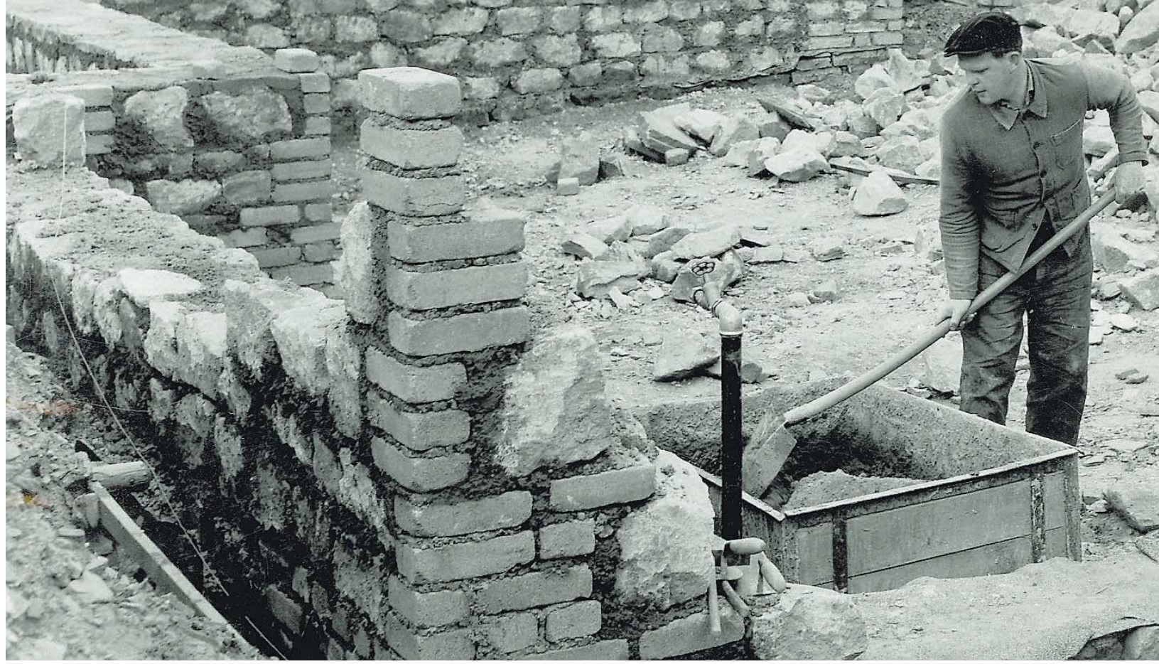
Der Bergmann als Bauherr und Baumeister. Dieses Foto stammt aus dem Jahr 1962 und steht stellvertretend für alle Bergarbeitersiedlungen im Saarland.

Bergmannswohnungsbau Seit 60 Jahren steht die Stiftung StWB für Wohnungsbau der Bergarbeiter an der Saar. Auch hier in unserer Region finden sich solche Siedlungen.