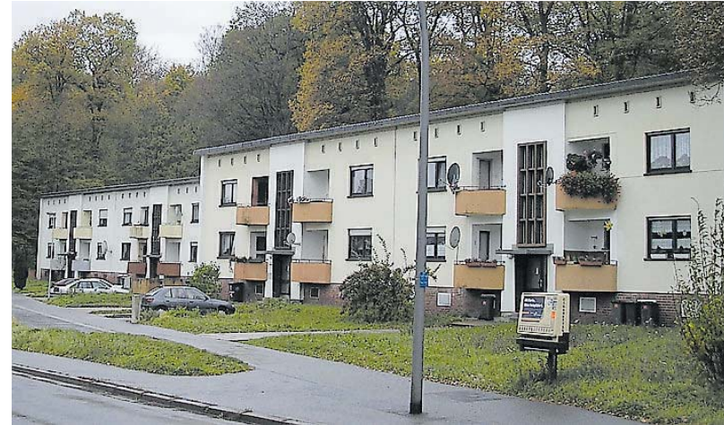
Die heutige Bebauung in der Altenkesseler Straße in Luisenthal stammt aus den 1950er Jahren.

Dorf im Warndt wurde 1938 mit Selbsthilfeleistung der Siedler durch die Saarbrücker Gemeinnützige Siedlungsgesellschaft als nationalsozialistische Mustersiedlung inmitten der Waldlandschaft des Warndt errichtet. Untergebracht wurden in der so genannten Kleinsiedlung mit Nebenerwerbsstellen – also mit Gärten und Flächen für die Haltung von Kleintieren für die Selbstversorgung – vor allem Arbeiter, die auf der Völklinger Hütte beschäftigt waren, mit ihren Familien. Ende 1960 wurde mit dem Bau einer neuen Werksiedlung, jetzt für die Bergleute der neu geschaffenen Grube Warndt, begonnen. Bis 1964 entstanden so insgesamt 268 Wohnungen. Die Häuser der Werksiedlung entstanden in vier Varianten, die den persönlichen Wünschen und dem Familienstand der Einlieger gerecht werden sollten. Drei Haustypen verfügen über jeweils drei Zimmer, Küche und Bad, der